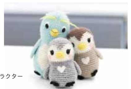
東京都里親制度普及啓発キャラクター 「さとべん・ファミリー」▶

身近な人たちが自分たちを知った上で受け入れてくれている。適切に関わってくれる。そのことが里親家庭や社会的養護の子どもにとって、「安心」という支援になるのではないのでしょうか。