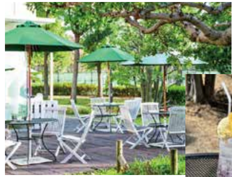
緑に囲まれたテラスで、クリームソーダ「ラストクォーター（下弦の月）」はいかがですか？

都立府中の森公園の桜並木を眺めながら、アートに包まれた特別な時間を過ごせる府中乃森珈琲店。アートが好きな人もそうでない人も、ふらりと立ち寄ってみてはいかがでしょうか。