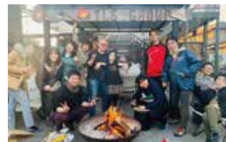
焚き火イベントの様子▶

一方、支援をする人にとっても、「相談」や「支援」と聞くとハードルが高いと感じてしまうのも事実です。そこで、私の友人が「お腹空いたら連絡してね」という言い方をされていて、とても良い伝え方だなと感じました。「何かあったら相談して」とよく言われますが、「何かあったからの相談」はしづらいですよね。それよりも食事のただの雑談でいいんです。雑談がやがて相談へとつながっていきます。そんな関係性が作れる「場」が、地域全体に根付いたらいいなと思っています。