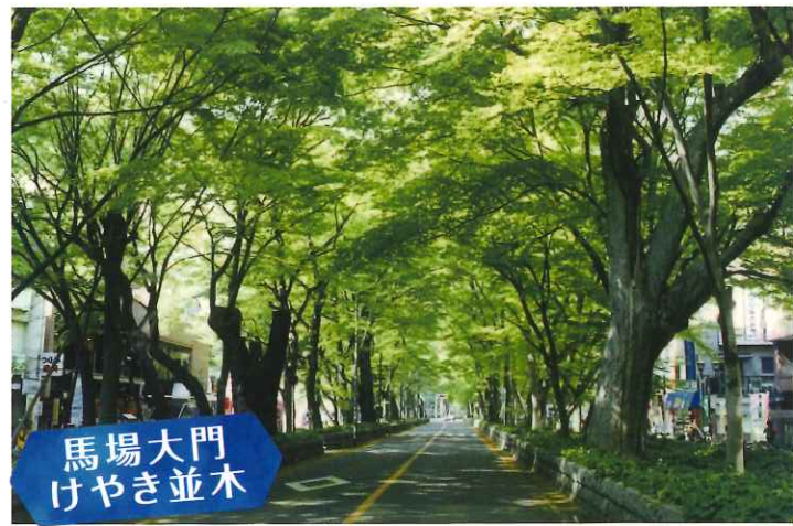
馬場大門 けやき並木

日時：毎週木曜日・毎月第1土曜日 午前10時から(約2時間程度) (ただし7/20~8/31、及び12/20~1/7は休み)※雨天中止