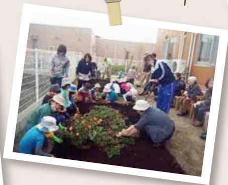
ニチイケアセンター西府にて。 お年寄りも保育園児も、一緒に 苗を植えます。