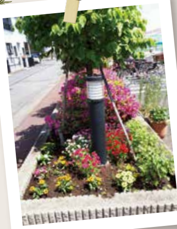
ケアハウス利用者のみなさんと、 きれいな花壇ができました！

無理はしないで「出来る時に出来るだけ」をモットーにゆる〜く活動しています。「もっと魅力的な公園が府中に増えるといいな」と願いながら、今後もボランティア活動を続けたいと思います。