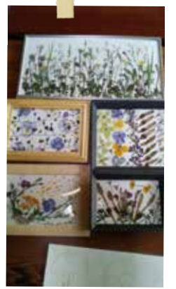
手作りの押し花を並べて、 季節感のあるインテリアを。