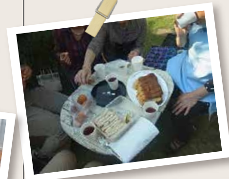
作業が終わると、みんなで お茶会。花のことで自然に 話がはずみます。